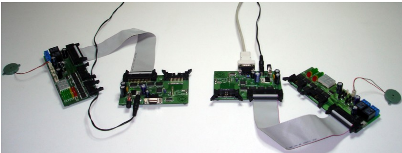
Figura 1: Montagem de dois Kits com o Módulo de Motores e Displays e o buzzer.

O programa desenvolvido nesse tutorial vai utilizar dois Kits. Os dois deverão ter o Módulo Principal e Módulo de Motores e Displays com o Buzzer conectado. Para a criação do programa será necessário o Borland Delphi 6. A seguir a imagem da montagem do Kit necessária para esse tutorial.